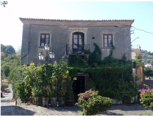
Bar Vitelli in Savoca

Nach der Mittagspause fahren Sie weiter nach Savoca , das 2009 in die Liste der schönsten Dörfer Italiens aufgenommen wurde. Berühmtheit erlangte das Dorf durch die Filmtrilogie „Der Pate“ von Francis Ford Coppola, der den Ort als Drehort für verschiedene Szenen wählte. So zum Beispiel die Kirche San Nicolò und die Bar Vitelli, in der Coppola und auch Al Pacino ein und aus gingen.