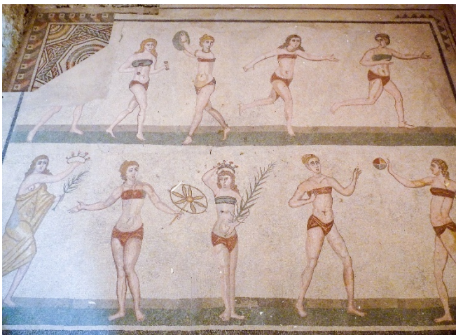
Bikini-Mädchen in der Villa del Casale