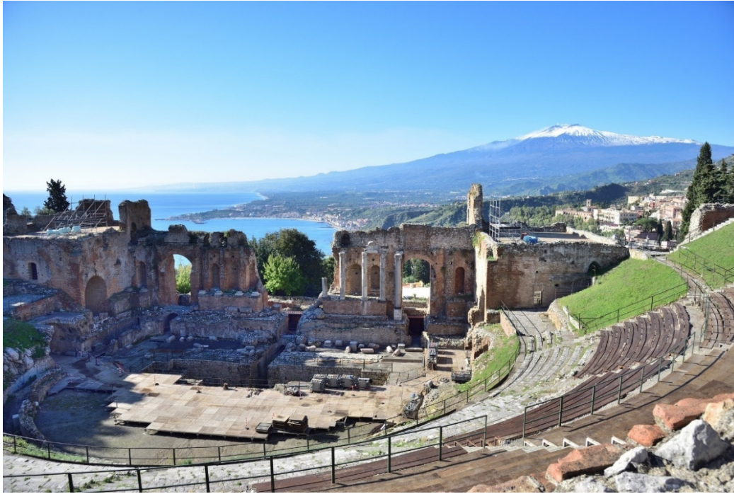
Theater von Taormina

„Die Königin der Inseln“ liegt in der Mitte des Mittelmeeres, halbwegs zwischen Gibraltar und Suez sowie Tripolis und Rom. Im Altertum bildete sie eine Kulturbrücke zwischen Morgen- und Abendland , zwischen Europa und Afrika. Von Griechen kolonialisiert, von Rom zur Kornkammer Italiens gemacht, hat sich die Insel eindrucksvolle Zeugnisse ihrer überaus wechselvollen Vergangenheit bewahrt. Das reiche kulturelle Erbe beschränkt sich jedoch nicht nur auf die Antike: Araber, Normannen, Staufer und Spanier – sie alle haben ihre Spuren hinterlassen.