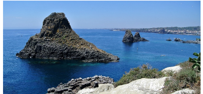
Zyklopeninseln CC0 Wilson44691 at-wikimedia.commons

Mit vielen neuen Eindrücken heißt es heute Abschied nehmen von Sizilien. Fahrt zum Flughafen Catania und Rückflug nach Köln.