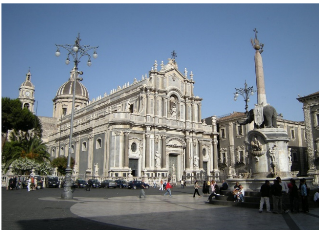
Catania CCBASA2.0 Leandro Neumann Ciuffo at-wikimedia.commons

Nach der individuellen Mittagspause haben Sie noch Zeit zur freien Verfügung. Nutzen Sie diese für einen Bummel auf der Via Etnea, besuchen Sie eines der zahlreichen Museen der Stadt oder genießen Sie das bunte Treiben bei einem Cappuccino.