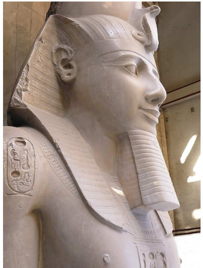
Kolossal-Statue Ramses II im Eingang des GEM in Kairo

Gemeinsames Mittagessen in einem Restaurant in Gizeh.