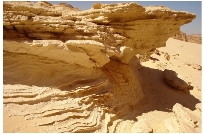
Felsen auf dem Sinai

Und schon tauchen Sie ein in die Faszination Sinai , in die Heimat der Jebeliya-Beduinen , die in der Einsamkeit des Gebirges, in der Stille der Wüste und in den fruchtbaren Oasen ihren perfekten Lebensraum gefunden haben. Sie leben hier schon seit über 1400 Jahren , denn im 6. Jh. befahl der byzantinische Kaiser Justinian den Bau des Katharinenklosters und postierte hier 200 Soldaten mit ihren Familien, um das Kloster zu schützen. 100 dieser Männer wurden aus Ägypten gebracht und die anderen 100 aus verschiedenen Teilen des Byzantinischen Reiches. Seitdem hat sich dieses Volk seine uralten Kulturen bewahrt.