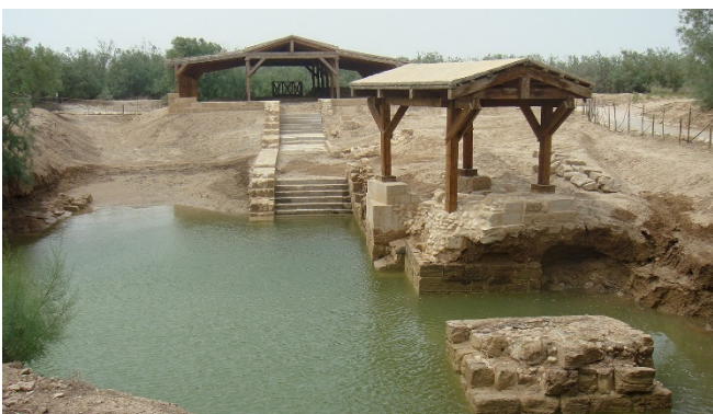
Taufstelle am Jordan

Am Vormittag führt ein Ausflug nach Bethanien . Nach biblischer Überlieferung befand sich hier am Ufer des Jordan die Stelle, an der Johannes der Täufer Jesus getauft hat. An dieser Stelle feiern Sie einen gemeinsamen Gottesdienst. Anschließend besuchen wir die Ausgrabungen der antiken Stätte, die seit 2015 zum UNESCO-Weltkulturerbe zählen.