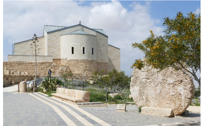
Moses-Gedächtniskirche auf dem Berg Nebo

Weiterfahrt zum heiligsten Ort Jordaniens : Auf dem Berg Nebo soll sich das Grab Moses befinden. Bereits im 4. Jh. errichtete man hier eine Kirche zu seinen Ehren und der Berg wurde zur christlichen Pilgerstätte. Wie einst Moses auf das „ Gelobte Land “, blicken auch Sie vom Gipfel des Nebo auf das weite Panorama, das sich eindrucksvoll vom Jordantal und dem Toten Meer über Jericho bis nach Jerusalem erstreckt.