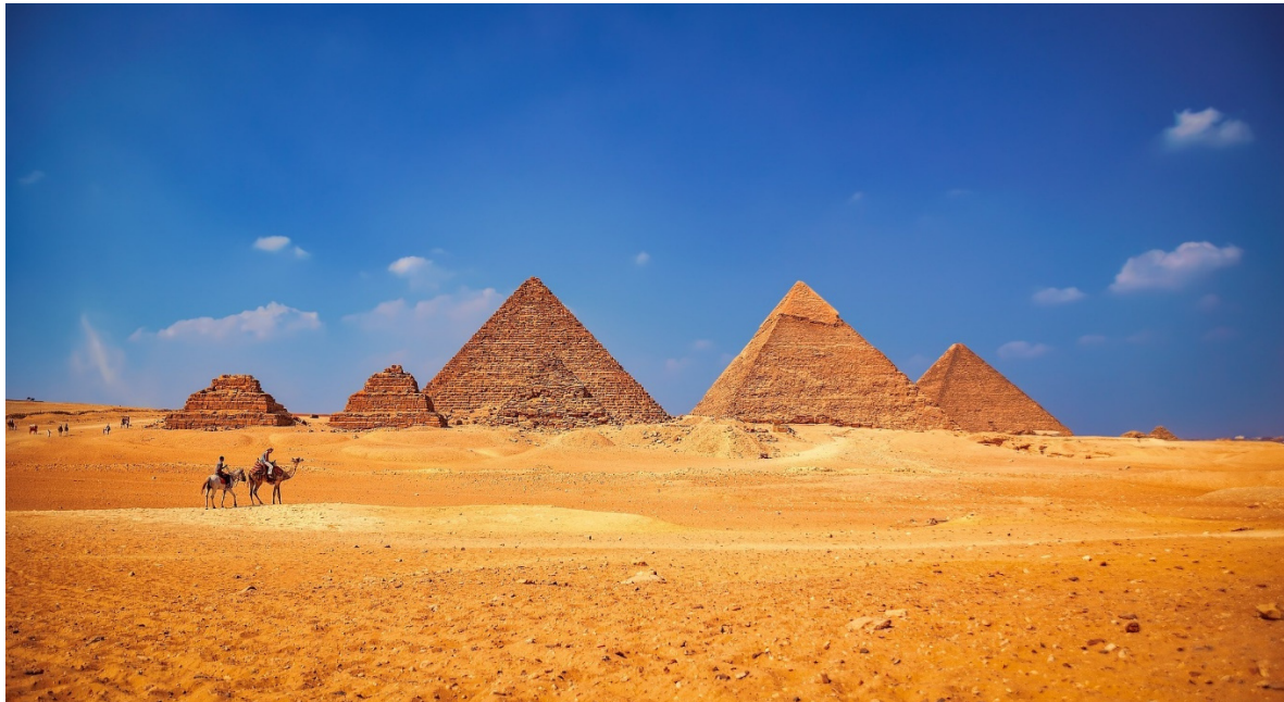
Pyramiden von Gizeh

Der Orient: so nah an Europa und doch so anders. Das Morgenland fasziniert uns schon seit den Geschichten aus 1001 Nacht. Spätestens seit der Entdeckung des Grabes des jungen Pharaos Tutanchamun durch Howard Carter geht von den Baudenkmalern, Gräbern und Kultstätten des Orients eine mystische und faszinierende Wirkung aus.