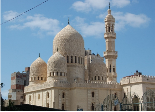
Abu al Abbas el-Mursi Moschee

Bevor es wieder nach Kairo geht besuchen Sie die Abu al Abbas el-Mursi Moschee , die zu Ehren des Heiligen aus Andalusien errichtet wurde. El-Mursi, der Sufiheilige , lebte im 13. Jh. bis zu seinem Tod als Gelehrter in Alexandria. Der auffällig schöne Bau mit andalusischen Stilelementen und italienischen Säulen aus Rosengranit wurde erst 1945 fertig gestellt.