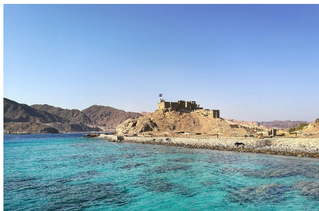
Am Roten Meer

Das Abendessen ist in den All Inclusive-Leistungen des Hotels enthalten.