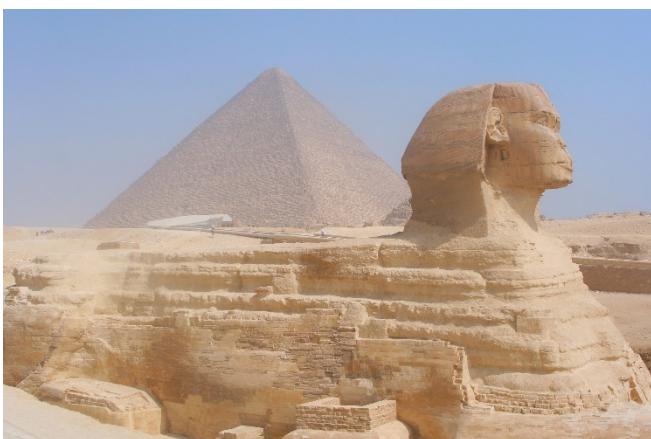
Sphinx von Gizeh

Mit der Mykerinos-Pyramide (Außenbesichtigung) sehen Sie die kleinste Pyramide des Plateaus. Sie ist nur etwa halb so groß wie ihre „großen Schwestern“. Auch sie wurde mit Kalkstein verkleidet, die inneren Lagen bestanden aus Rosengraniteinfassungen.