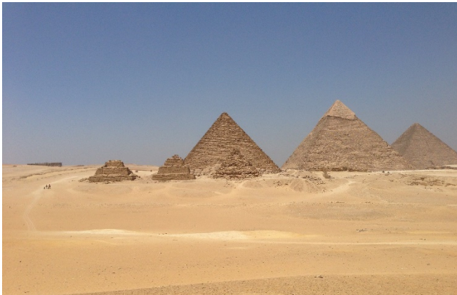
Pyramiden von Gizeh

Am Nachmittag widmen Sie sich den Pyramiden von Gizeh – seit 1979 UNESCO-Weltkulturerbe . Sie stammen vermutlich aus der Zeit zwischen 2620 und 2490 v. Chr. Ihre Erbauung war ein unvorstellbares Unterfangen. Jeder Steinquader wiegt Tausende von Kilo, und es ist bis heute nicht genau erforscht, wie die alten Ägypter diese enorme Aufgabe ohne moderne Technik leisten konnten.