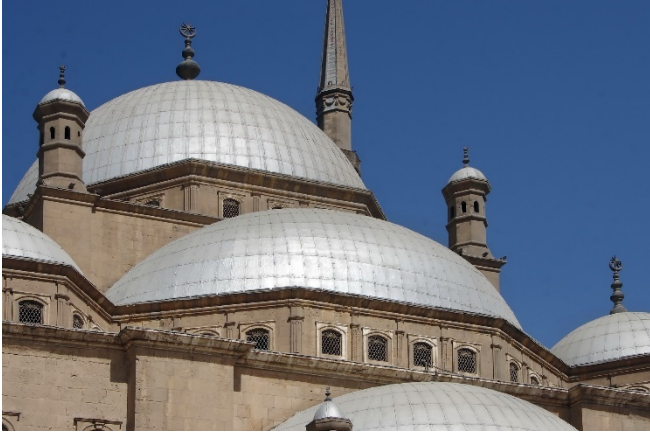
Alabaster-Moschee in Kairo

Bahnfahrt mit Lufthansa Express Rail von Köln zum Flughafen Frankfurt. Nach dem Reisesegen in der Flughafenkapelle gemeinsamer Flug nach Kairo. Erledigung der Einreiseformalitäten und Begrüßung durch Ihre örtliche Reiseleitung. Transfer zu Ihrem Hotel im Zentrum von Kairo und Zimmerbezug für 3 Übernachtungen. Mit einem gemeinsamen Abendessen im Hotel klingt der Tag aus.