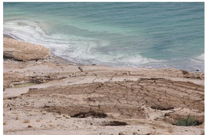
Am Toten Meer

Zurück im Hotel, können Sie die heilende Kraft des mineral- und salzreichen Wassers des Toten Meeres selbst ausprobieren. Sie befinden sich hier mit ca. 400 Metern unter dem Meeresspiegel am tiefsten See der Erde. Beim gemeinsamen Abendessen werden Sie sicher die Reise noch einmal Revue passieren lassen.