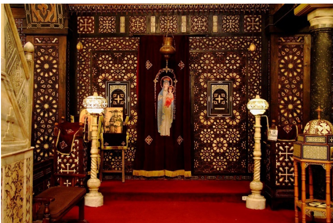
Hängende Kirche

Im farbenfrohen Souk al Fustat haben Sie etwas Zeit für individuelle Entdeckungen. In einem nahe gelegenen Restaurant werden Sie zu einem gemeinsamen Mittagessen erwartet.