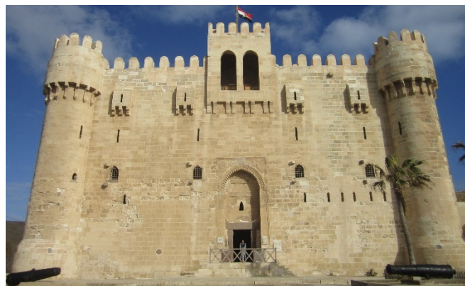
Zitadelle von Qaitbay

Zum Auftakt besuchen Sie die Neue Bibliothek . Das Großprojekt beherbergt nicht nur einen immensen, dreisprachigen Buchbestand, sondern auch Museen, Kunstgalerien und Forschungszentren. Es wurde mit Hilfe der UNESCO in der Nähe der einstigen, bedeutenden Alexandria-Bibliothek errichtet, die durch einen Brand und spätere Erdbeben völlig zerstört wurde.