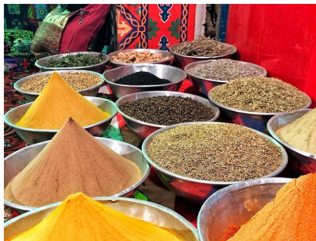
Gewürze auf dem Basar

Da sich die Moschee inmitten des Alten Basars von Sharm-El-Sheikh befindet, haben Sie anschließend etwas Zeit, um über den Markt zu bummeln. Tauchen Sie ein in die farbenfrohe Welt des Orients mit unzähligen Ständen voller Handwerkskunst, kulinarischen Leckereien, bunten Stoffen und duftenden Gewürzen.