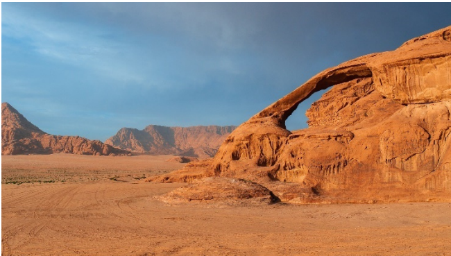
Felsformation im Wadi Rum

Am Nachmittag setzen Sie die Fahrt in Richtung Wüste fort. Dem legendären Desert Highway folgend, erreichen Sie das Wadi Rum . In der mystischen Kulisse dieses weltberühmten Naturreservats werden die Geschichten um Lawrence von Arabien lebendig.