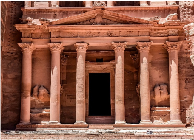
Schatzhaus des Pharao in Petra

Nach dem Spaziergang durch den Siq , einer 1200 Meter langen und 70 Meter hohen Schlucht, bildet die imposante Felsspalte den Eingang zur Felsenstadt. Bei einer minimalen Breite von drei Metern versteht man gut, welchen Beitrag der Siq einst zur Verteidigung der Stadt leistete. Alle Karawanen, die in Petra Station machten mussten ihn zunächst passieren, so wie Sie heute. Plötzlich endet der Schacht (Siq) und die eindrucksvolle Schatzkammer des Pharao , wie die Beduinen das weltberühmte Bauwerk nannten, liegt vor Ihnen. Sie vermuteten reiche Schätze in der großen Urne auf der Spitze, es handelt sich jedoch um eine Grab- und Kultstätte .