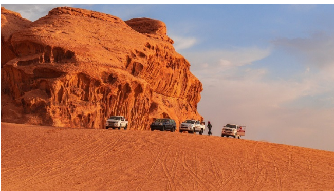
Jeep-Tour im Wadi Rum

Per Jeep erleben Sie heute die Schönheit des Wadi Rum mit all seinen Schluchten, Tälern, Dünen und Felsformationen. In den zahlreichen Canyons finden sich Felszeichnungen aus prähistorischer Zeit , das Gebirge aus Granit und Sandstein beeindruckt mit spektakulären Felsbrücken und die herrliche Wüstenlandschaft strahlt in rötlicher Farbe.