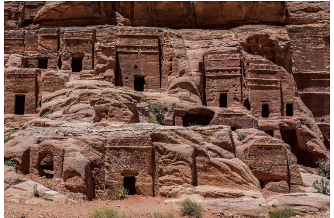
Little Petra

Danach setzen Sie die Reise fort und erreichen das verborgene Tal von Little Petra , das weitgehend unbekannt ist und von Touristen kaum besucht wird. Vom Siq al Barid (kalte Schlucht) aus geht es durch die Baida Region in Richtung der Schluchten von Petra, bis Sie das Kloster hoch über dem Hauptplatz erreicht haben. Hier erwarten Sie herrliche Ausblicke über den Grabenbruch des Wadi Araba .